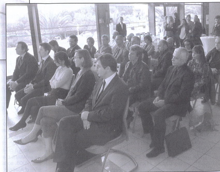
Une conférence de presse pour la présentation du portail internet « J'entreprends en Corse » a été organisée le 25 octobre dernier, dans les locaux bastiais de l'ADEC, situés à la maison du parc technologique, en présence de nombreux partenaires de la création d'entreprise en Corse

Enfin, l'un des objectifs sera bien sûr d'accroître la communication pour développer l'esprit d'entreprendre, cher à notre Agence de développement économique. Et nul doute que le portail internet «J'entreprends en Corse» deviendra un outil incontournable de l'information et de l'orientation entrepreneuriale en région Corse.